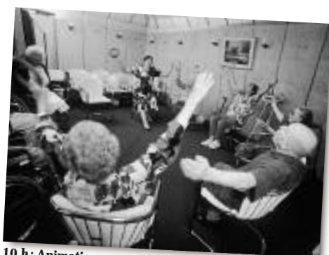
10 h: Animation - gymnastique La gymnastique douce permet aux résidents d'exercer leurs réflexes.