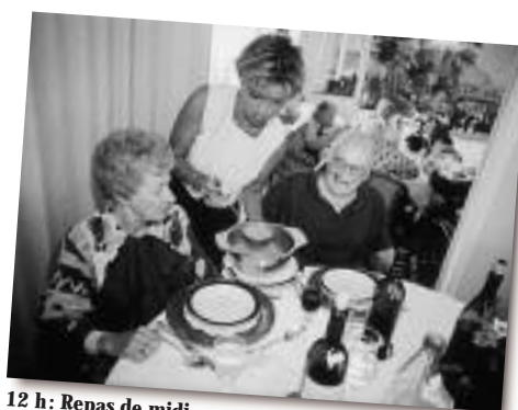
12 h: Repas de midi Le service est assuré par du personnel venant de l'extérieur, ce qui confère au repas une ambiance plus hôtelière. Au menu, un repas complet et équilibré.

EMS Dans un EMS, les principales activités du personnel soignant consistent à accompagner et à aider les résidents plus que de prodiguer des actes techniques. L'ems à l'écoute de votre bien-être!