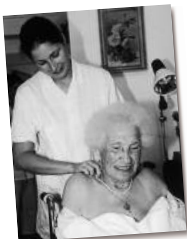
En marge des soins - massage Une infirmière prodigue un massage de la nuque à une résidente.