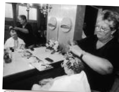
Coiffeuse Permanentes, bigoudis, coiffage, le bien-être passe aussi par une bonne image de soi.