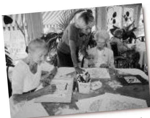
Animation - dessin L'équipe d'animation met sa créativité au service des personnes hébergées, qui exercent en même temps leur habileté et leur imagination.